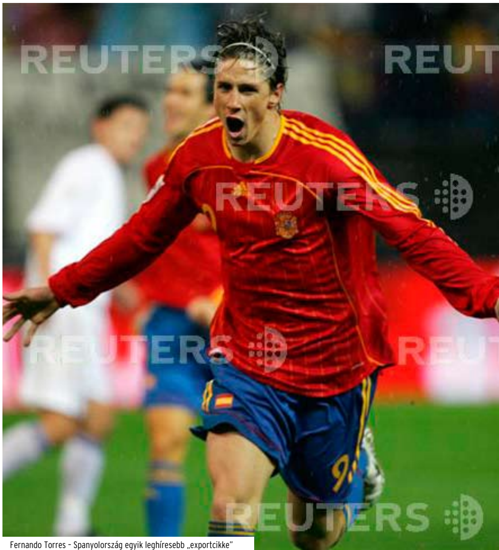
Fernando Torres - Spanyolország egyik leghíresebb „exportcikke”

„...SPANYOLORSZÁG ÜDE VÁLTOZATOSSÁGOT KÍNÁL, HISZEN NEM KÖTI GÚZSBA A BORVIDÉKEK IRÁNT TÁPLÁLT HAGYOMÁNYOS, ALÁZATOS TISZTELET, EZÉRT ÓRIÁSI LEHETŐSÉGEK REJLENK BENNE.”