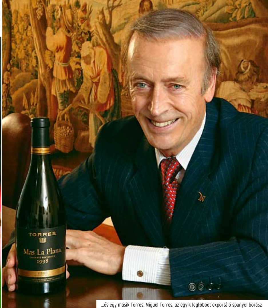
...és egy másik Torres: Miguel Torres, az egyik legtöbbet exportáló spanyol borász